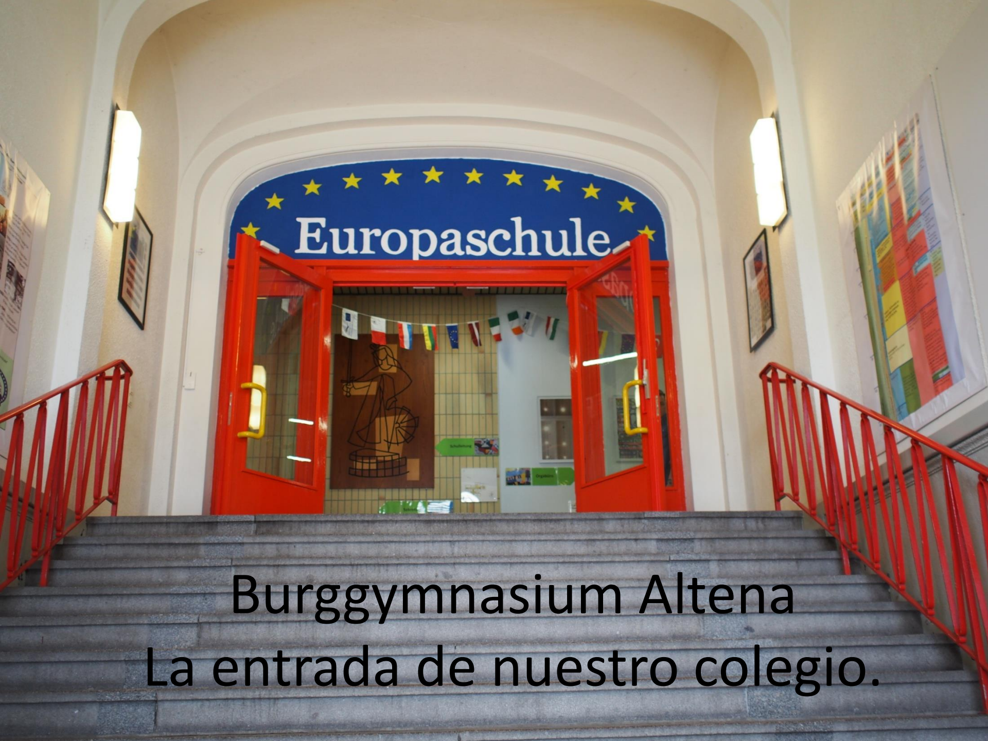
Burggymnasium Altena La entrada de nuestro colegio.